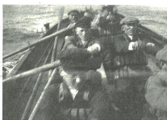
Von eigenen Fotos Gemälde werden: „Im Rettungsboot“ (1927).