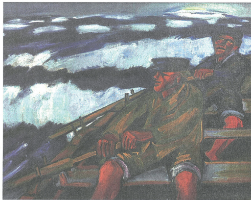
Durch radikale Bildschnitte schafft Max Pechstein Dynamik. Wie hier bei „Fischer im Boot“ (1923).