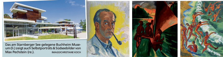
Das am Starnberger See gelegene Buchheim Museum (l.) zeigt auch Selbstporträts & Südszenen von Max Pechstein (re.).

Sie lassen es knallen. In satten grünen und blauen Farben leuchten die Wände im Buchheim Museum Bernried am Starnberger See. Eine gute Idee. Denn die kräftigen Töne verstärken noch das Leuchten, das in den Bildern selbst liegt, die in der Ausstellung „Max Pechstein – Vision und Werk“ zu sehen sind. Der Künstler (1881-1955) hat mit seinen farblustigen Gemälden und seiner ausdrucksstarken Druckgrafik die Kunst des 20. Jahrhunderts geprägt. In Bernried versteht man, warum.