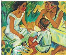
Hermann Max Pechstein | „Unterhaltung“ 1920 | Ergebnis: € 908.000

Max Pechstein (1881–1955) zählt zu den bedeutendsten Künstlern des deutschen Expressionismus. Als Mitglied der Künstlergruppe „Brücke“ prägte er die Avantgarde des frühen 20. Jahrhunderts. Mit seinem musealen Werk „Unterhaltung“ bringt er seine Sehnsucht nach exotischen Kulturen auf die Leinwand. Von einem deutschen Privatsammler 2023 bei VAN HAM erworben, geht es nun als Leihgabe mit der Ausstellung „Max Pechstein. Vision und Werk“ auf internationale Museumstournee. Diese zeigt die künstlerische Entwicklung Pechsteins über sieben Jahrzehnte und thematisiert dabei Schlüsselwerke von den frühen Gemälden der Brücke-Ara bis zu Südsee-Motiven. Im März 2025 startete sie in der Kunsthall in Rotterdam in den Niederlanden. Ab dem 19. Juli ist die Ausstellung im Buchheim Museum in Bernried am Starnberger See zu sehen. Weitere Museen in Deutschland, Österreich und der Schweiz haben Interesse bekundet, aber auch bekannte Häuser in den USA und im asiatischen Raum, heißt es von der Zwickauer Kunstsammlungen.